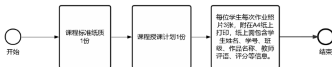
图 1. 归档流程图

（三）专业课程学期内作业材料归档时，考虑到艺术类专业的特殊性，设计作品可通过拍照方式进行保存。每位学生每次作业3张照片（不同角度），并将照片附在A4纸上，打印出来，学生写上姓名、学号、班级、作品名称等信息；教师写上评语、评分，以班级单位整理归档，以此形式形成一次作业存档。（详见流程图）